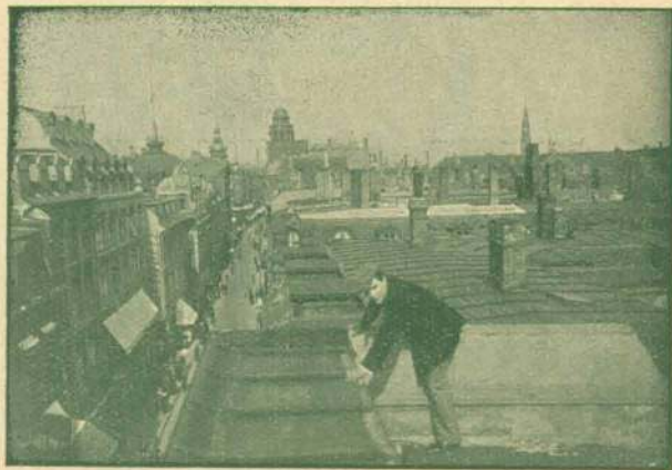
Over Byens Tage.

„Førdømt! — Nu gælder det at forsvinde hurtigt!“ Og i et Nu er han ude af Hotellet, ude paa Marken. Ved en Bondegaard staar et Læs Halm. Her er Skjulested for Natten. Han borer sig midt ind i Halmlæsset. Næste Morgen tidlig vil han atter ud, men da kører Læsset til hans Rædsel bort — til Hejseladen. Et Par vældige Tæn-