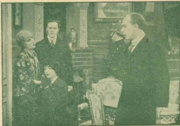
„Ja! Ja! Det var mig — — —“

Ogsaa nede i Selskabet foregaar der mærkelige Ting. Miss Keans Mistanke til „Watson“ er bestyrket, hun har fulgt ham paa hans hemmelige Smutten ud i Haven. Nu