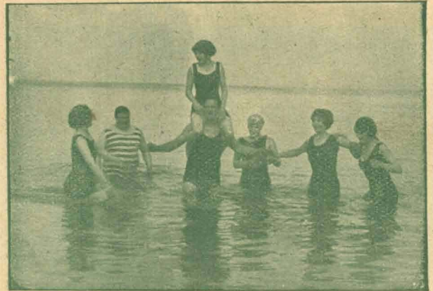
Detektiven gør en Opdagelse fra Strandbredden.

Næste Dag er det livlige Selskab hos Alice forsamlet. Blandt Gæsterne er Dr. Nicholson, forklædt som Detek-tiven Watson. Han gør stærk Kur til Miss Kean, men han forekommer hende mistænkelig. — Efter Bordet underhol-der den joviale Mr. Brown Selskabet med nogle glimrende Tryllekunstner. Gæsterne er saa optagne heraf, at Dr. Ni-