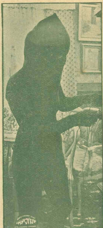
Toto med den elektriske Strom.

Eneret: Danmark: A/s Kinografen, København Norge: Kinografens Films-Bureau, Bergen.