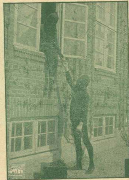
Raketten er steget tilvejs.

„Jeg har undersøgt alt! Denne Gang skal det lykkes mig at faa fat i den blaa Diamant!“