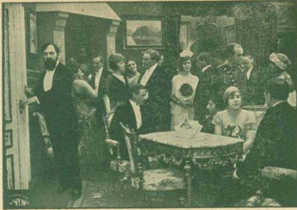
— Men et vaagent Øje følger ham —