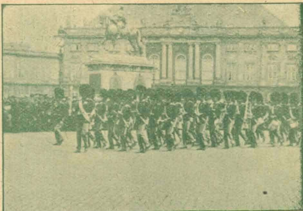
Vagtparaden trækker op.

Lidt efter staar samme „Detektiv“ i Nicholson's skjulte