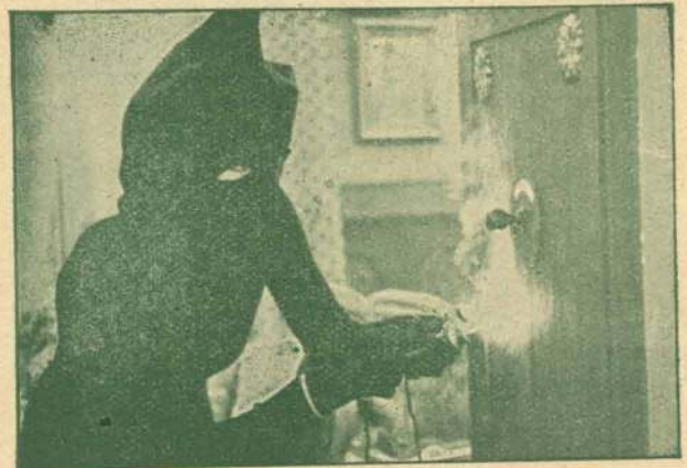
Laasen smeltes aa.

Og han forklarer Dick og Toto (hans mandlige og kvindelige Medhjælpere) sin Plan. —