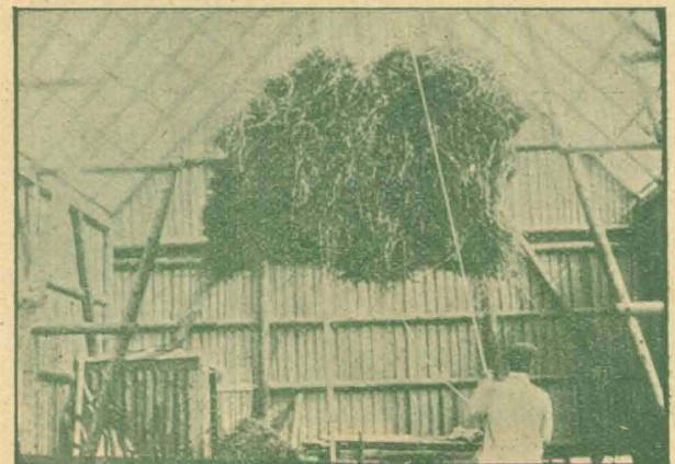
Nicholson i en farlig Situation.

Da Mørket er faldet paa, ses to sorte Skikkelser kaste sig paa en Motorcykle og snart efter ligge paa Lur i en