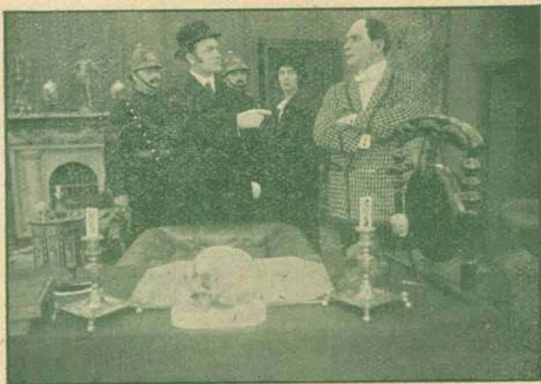
„Endelig har vi Dem, Dr. Nicholson —.“

vil hun vide alt, og da hun trækker Ringen af „Detektivens“ Finger, giver hun et Skrig: „Grib ham, det er Dr. Nicholson!“ Men en Røgbombe forvirrer Selskabet, og den mystiske Doktor er forsvunden.